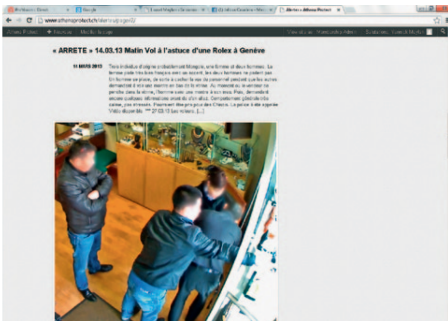
Vol à l'astuce d'une montre haut de gamme à Genève

Partant du constat que les horlogers-bijoutiers deviennent de plus en plus la cible de malfaiteurs et ayant été victime lui-même d'un braquage armé en 2008, l'horloger veveysan Yannick Meylan a mis en place en 2009 un réseau de partage et de transmission d'informations entre professionnels de la branche. La chaîne e-mail sécurité ainsi mise au point est à l'origine d'Athéna Protect, un service gratuit à disposition de tous les commerçants qui se sentent menacés.